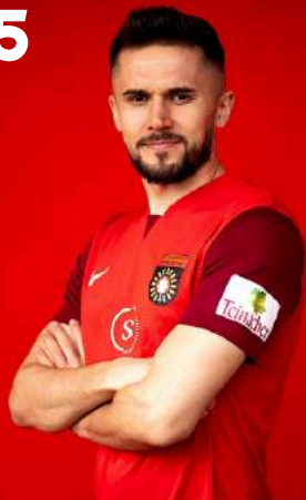
Volkan Celiktras ©