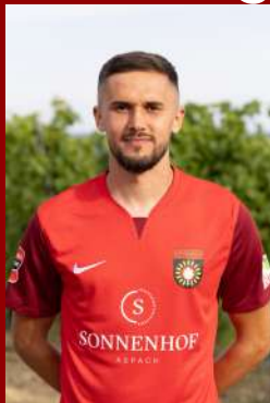
Volkan Celiktas ©