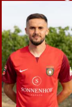
Volkan Celikras ©